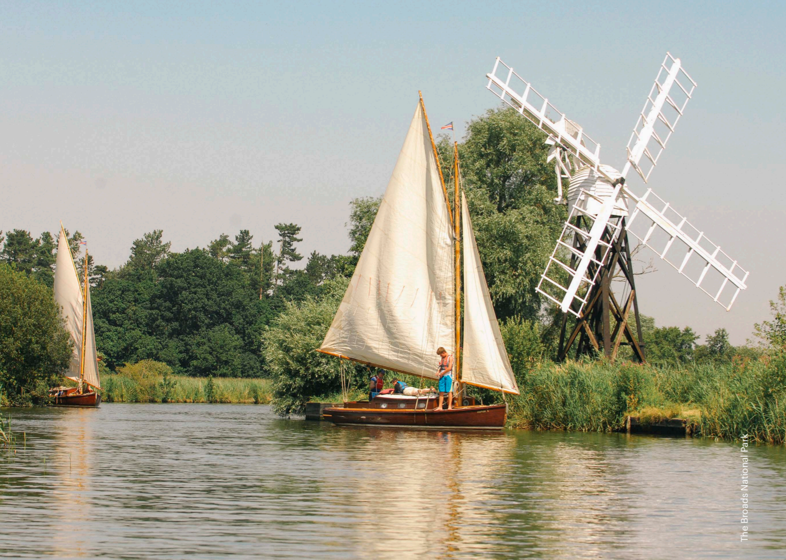
The Broads National Park