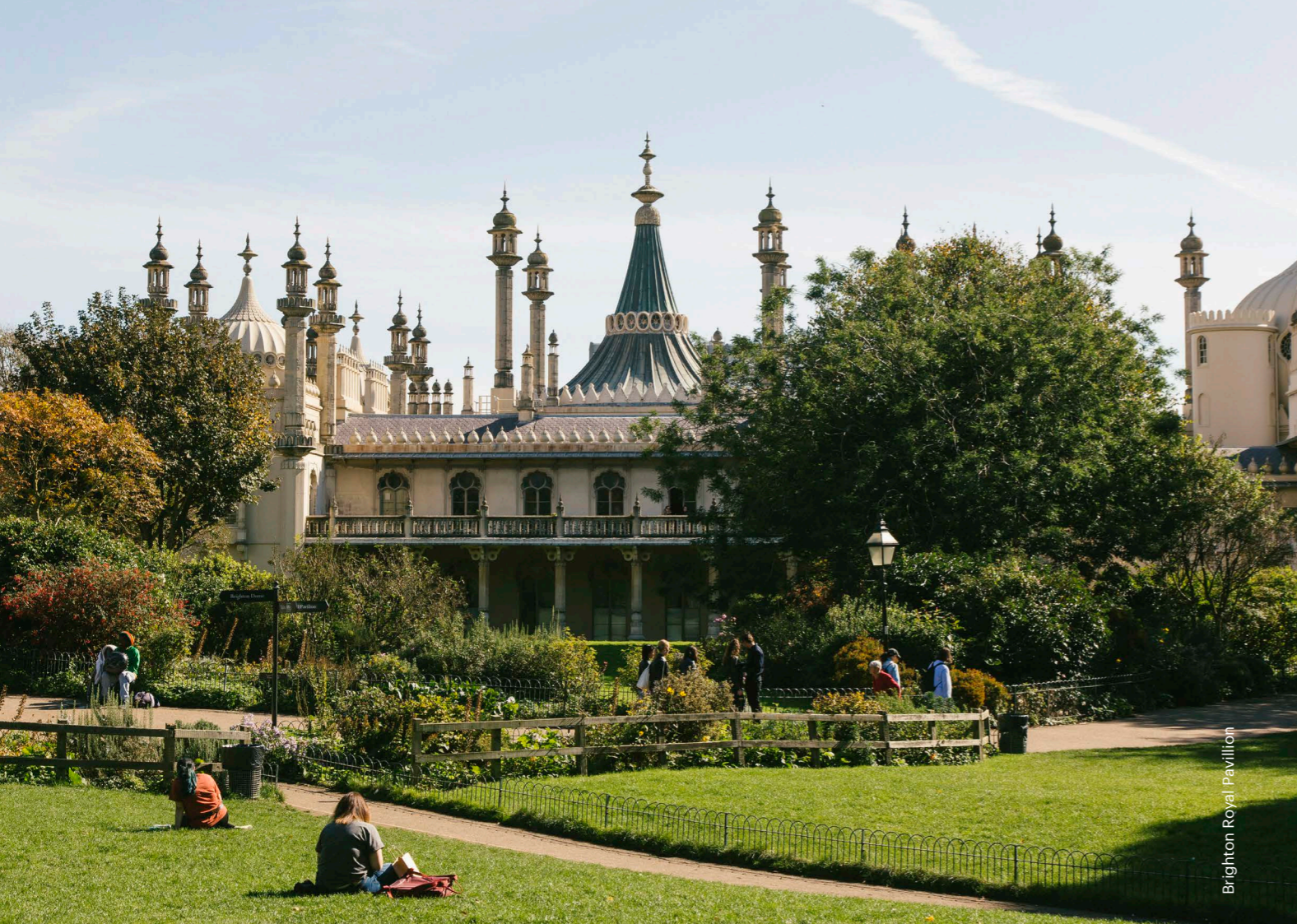
Brighton Royal Pavillon