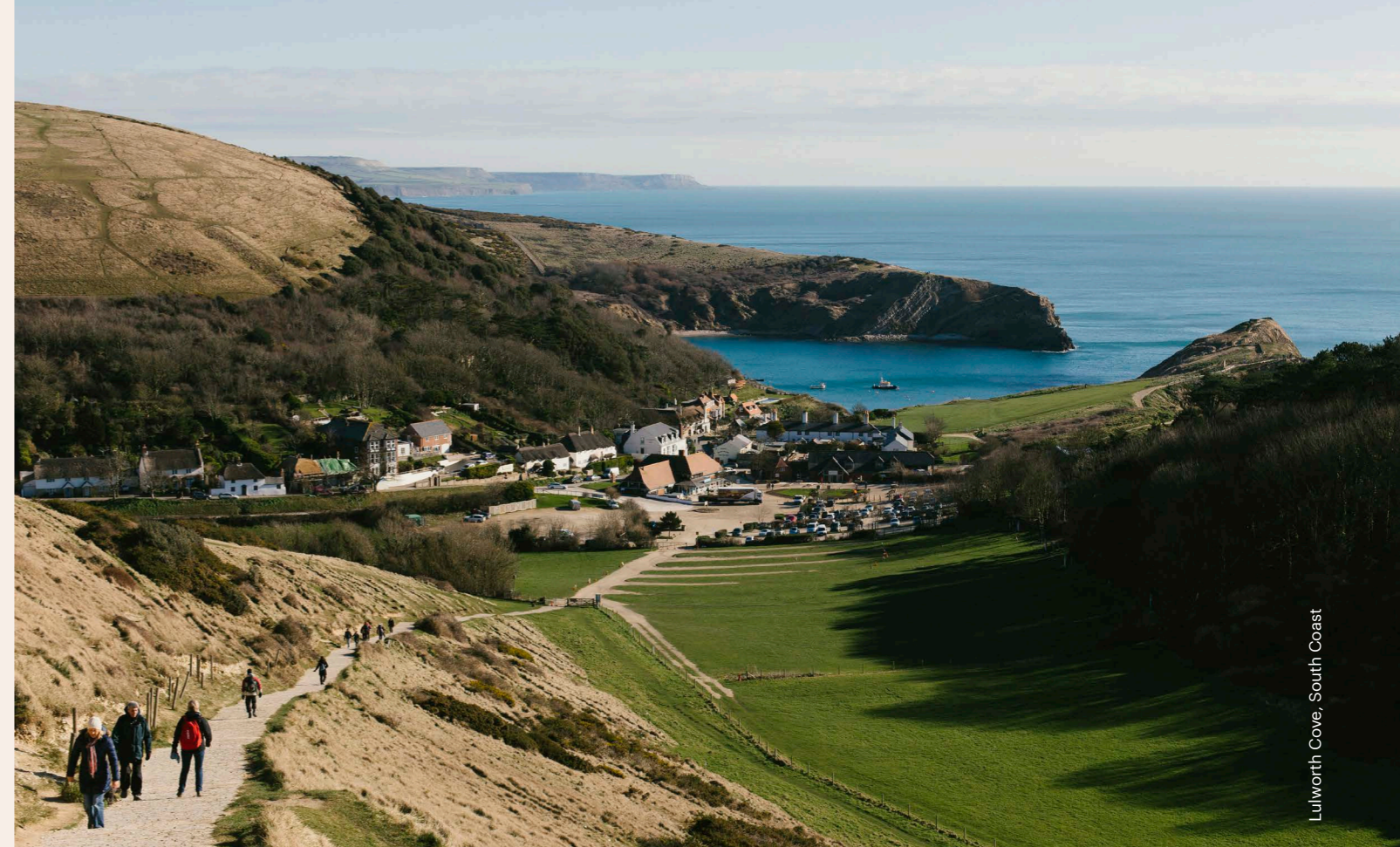
Lulworth Cove, South Coast