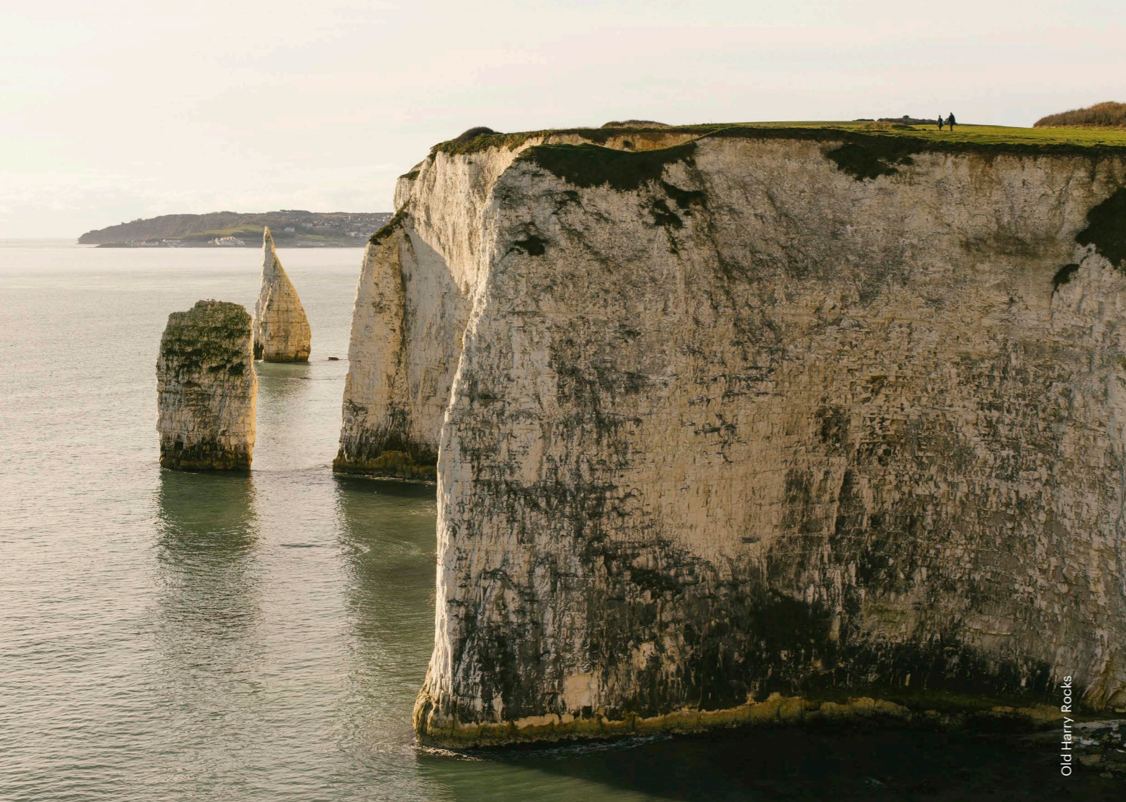
Old Harry Rocks